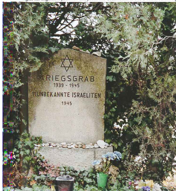
Massengrab für ungarische Jüdinnen und Juden mit Gedenkstein in Bad Deutsch-Altenburg

vor allem in jenen Orten, wo für sie eingerichtete Lager existierten bzw. wo im Verlauf der „Todesmärsche“ Massaker verübt wurden, etwa in Allhartsberg, Bad Deutsch-Altenburg, Emmersdorf, Göstling, Haag, Randegg oder Hofamt Priel. Einen besonderen Stellenwert nimmt hierbei das Gedenken an die ungarisch-jüdischen Zwangsarbeiter des Lagers Engerau (heute Bratislava-Petržalka, Slowakei) ein, die im März 1945 von österreichischen SA-Männern und NS-Funktionären ermordet wurden.