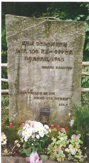
Gedenkstein in Schlieffau (Randegg)