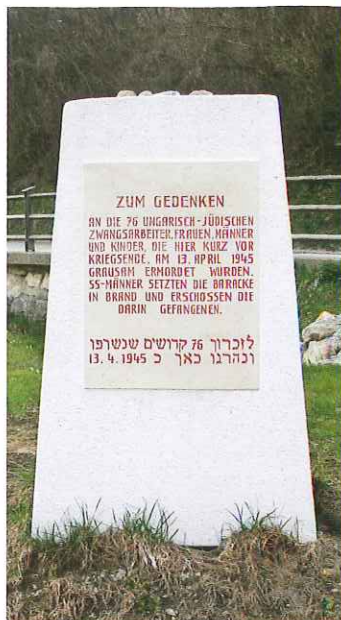
Gedenkstein für die ermordeten ungarisch-jüdischen ZwangsarbeiterInnen am Friedhof Göstling an der Ybbs

Eine der größten Opfergruppen in Niederösterreich sind ungarisch-jüdische ZwangsarbeiterInnen, die 1944 in den Gau Niederdonau deportiert wurden und in der Endphase der NS-Herrschaft ermordet wurden bzw. umkamen. Von Ende Mai bis Ende Juli 1944 kamen mehr als 15.000 ungarische Jüdinnen und Juden aus verschiedenen Ghettos im Auffang- und Durchgangslager Strasshof (Bezirk Gänserndorf) an, um in land- und forstwirtschaftlichen bzw. Gewerbebetrieben von Niederdonau Zwangsarbeit zu leisten. Ab November 1944 mussten etwa 35.000 ungarische Jüdinnen und Juden beim Bau des so genannten „Südostwalls“, einer Verteidigungslinie