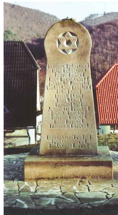
Gedenkstein für die jüdischen Opfer am Friedhof Purkersdorf

In den letzten Jahren ist ein Wandel in den Erscheinungsformen des Gedenkens an den Holocaust und der materiellen Zeichen-