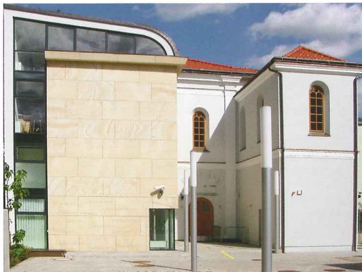
Die 2004 wiederinstandgesetzte Synagoge in Baden

Neben Zeichensetzungen für antischistische WiderstandskämpferInnen steht das Gedenken an die Vertreibung und Ermordung der Jüdinnen und Juden im Mittelpunkt der niederösterreichischen Erinnerungslandschaft.