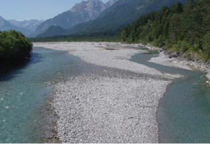
Foto oben: verzweigter Flusslauf des Lech Foto Mitte: kleinräumig sortierte Sedimente Foto unten: mäandrierender Flusslauf der Lafnitz